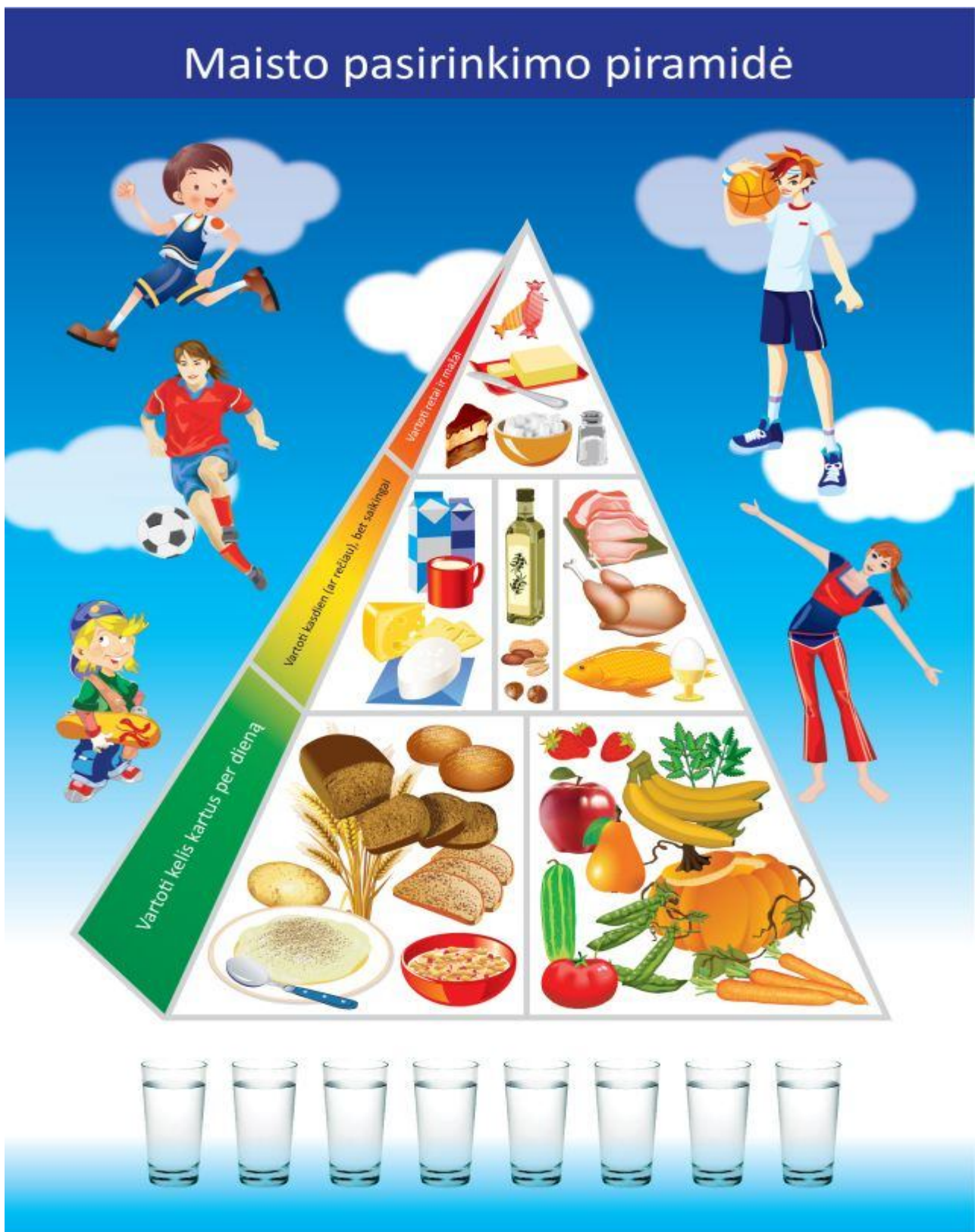
1 pav. Maisto pasirinkimo piramidė [14]

lentelė). Maisto asortimentas turi būti įvairus, būtina rinktis maisto produktus iš visų maisto produktų grupių, vadovaujantis maisto pasirinkimo piramide (1 pav.), gerti daug skysčių [7].